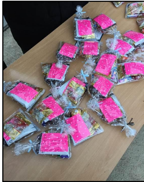
(▲국가고시 당일 선배님들을 응원하는 학생회 학생들과 준비해간 간식과 편지)

지난 1월 26일, 차 의과학대학교 간호학과 16, 17학번 학생회 임원들이 간호학과 4학년 학생들의 간호국가고시를 응원하러 잠실중학교에 나섰다. 그곳에 미리 나가, 준비해온 응원문구 피켓을 흔들고, 준비해온 간식, 음료, 핫팩, 그리고 선배들에게 쓴 쪽지를 전달했다. 시험 중간의 점심시간에는 차 의과학대학교 측에서 지원한 도시락을 직접 나눠주었다. 시험이 끝난 후, 시험을 쳤던 학생들은 후배들에게 고맙다며, '수고가 많았다', '추운데 감기 걸리지 않게 조심해라', '덕분에 기운이 났다'는 카카오톡 메시지를 남겼다. 후배들도 끝까지 응원의 메시지를 보내며 훈훈한 분위기를 유지했다.