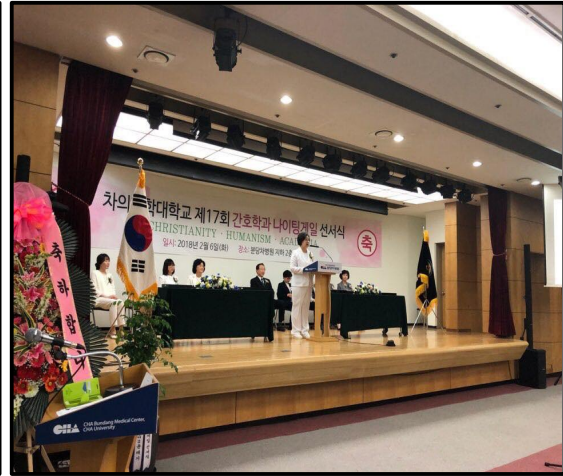
(▲ 나이팅게일 선서식 진행 모습)

2018년 2월 6일, 매서운 한파가 몰아치는 한 겨울날 차 의과학대학교 간호학과 제17회 나이팅게일 선서식이 진행되었다. 나이팅게일 선서(Nightingale Pledge)는 1893년에 만들어져 간호사로서의 윤리와 간호 원칙을 담은 내용을 간호 학도들이 맹세하는 의식이다. 임상실습을 나가기 전이나 졸업을 하기 전에, 간호학과 학생들은 손에 촛불을 든 채 가운을 착용하고 선서식을 거행한다. 촛불은 나이팅게일의 간호정신을 이어받으며, 주변을 비추는 봉사와 희생정신을 의미하고, 가운은 이웃을 따스히 돌보는 간호정신을 상징한다. 졸업을 앞두고 중요한 행사를 치른 선배들을 위해 학생회 임원들은 후배들을 대표해 축하공연을 하는 등 멋진 간호사로서 입장에서 일을 하실 선배들을 응원했다.