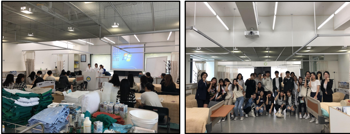
(▲ 실습 강의 중인 간호학과 학생들의 모습과 토요학교 체험학습 단체사진)

구리시 소재 고등학교 1-3학년 학생 20명과 두 명의 인솔교사가 방문하여 간호대학의 소개를 듣고 실습실, 시뮬레이션 실습실 체험 및 투어를 하였으며 17학번 교직원들의 지도 아래에서 근육주사 실습하는 시간을 가졌다.