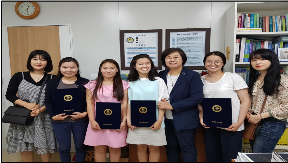
(▲ 2018년 몽골프로그램 수료식)