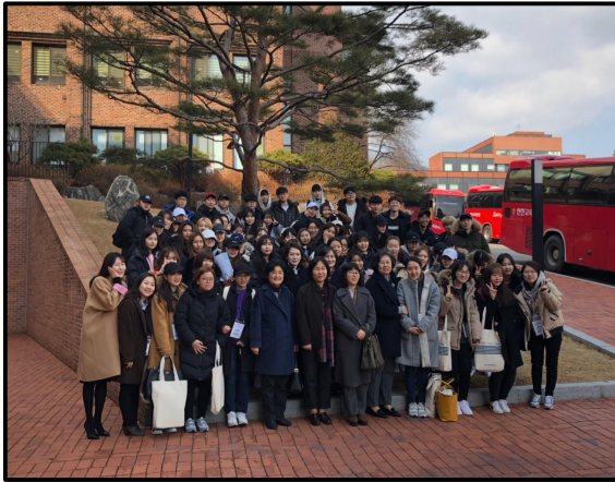
(▲ 신입생 오리엔테이션 후 단체사진)