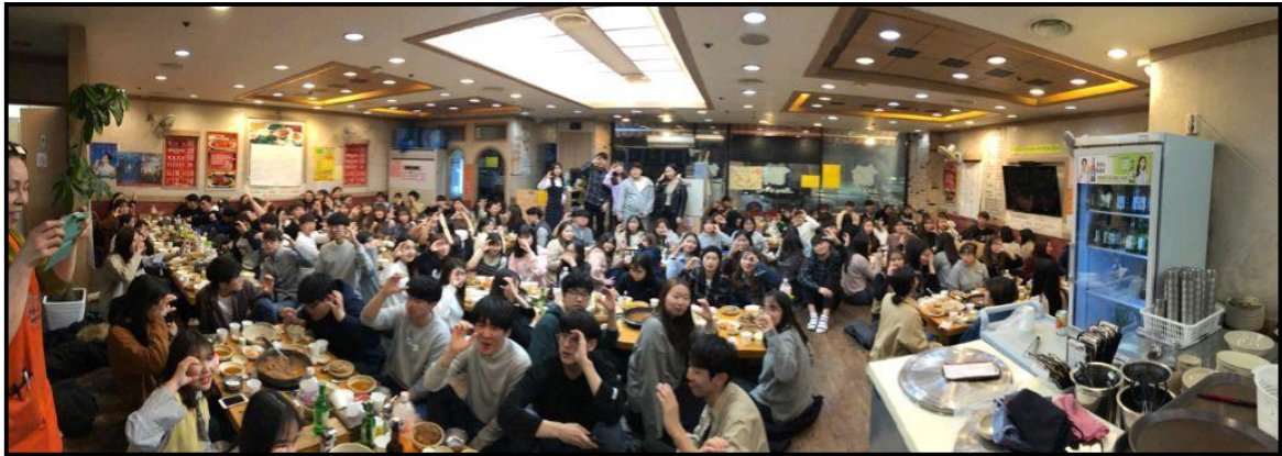
(▲ 송우리 '조마루 감자탕'에서 진행 된 17-18학번 대면식 모습)

2018년 3월 26일, 18학번 신입생들과 17학번이 다 같이 모여 서로 친목을 다지는 총대면식을 송우리 조마루 감자탕에서 개최하였다. 17학번과 18학번이 같이 앉아 저녁을 먹으며 대화를 나누는 시간을 가진 후에 뺨 선후배(같은 학번을 가진 선, 후배)끼리 나와 앞에서 자기소개를 하는 시간도 가졌다. 간호학과 1학년 김OO 학생은 “17-18대면식이라는 행사 덕분에 자연스럽게 선배님들과 가까워지며 학교생활이나 학습에 대한 조언이나 정보를 얻을 수 있어서 좋은 기회였다. 앞으로도 여태 마주치지 못했던 선배님들과도 친해질 수 있는 시간이 많아졌으면 좋겠다.”라고 소감을 전했다. 총대면식을 통해 선후배 간의 관계를 돈독히 하고 친목을 쌓을 수 있었다.