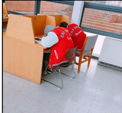
(▲ 미래관 휴게실에서 공부를 하는 18학번 학생들의 모습과 밤샘공부에 지친 학생들)

대학의 시험은 긴 마라톤과 같기에 페이스 유지가 가장 중요하다. 그 와중에 간호 학도들의 멘탈을 붙잡아 준 건 다름 아닌 ‘정’이었다. 선·후배들은 도서관 혹은 열람실에서 간단한 간식들을 서로 챙겨주었다. 그 결과 외롭게 싸우지 않고 서로 의지하며 공부에 더 집중할 수 있었다.