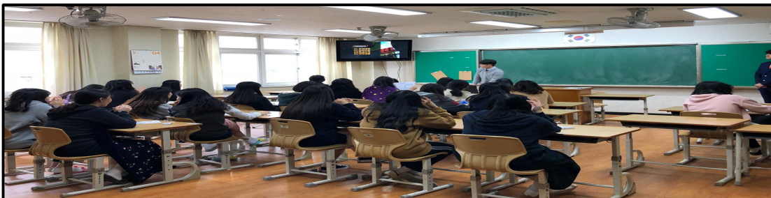
(▲ 특강에 참여 중인 학생들의 모습)