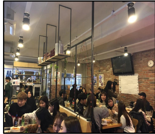
(▲ 신입생 개강파티 사진)

2018년 2월 28일부터 3월 1일까지 간호학과 신입생 오리엔테이션이 차 의과학대학교 포천캠퍼스에서 진행되었다. 대학교 생활이 처음인 신입생들을 위해 학교에서는 동아리 소개, 양성평등 교육, 시설 안내 등 여러 설명회를 준비하여 학생들에게 학교생활 관련 정보를 제공했다. 준비한 프로그램이 모두 끝난 후 정해진 강의실에서 간호학과 학생들만 모여 학과에 대한 전반적인 설명을 들었고, 간호학과 학생회, MED-TEAM(간호, 약대 의료봉사동아리), 비타노바(교육봉사 동아리)와 같은 간호학과 동아리 홍보가 이루어졌다. 또한, 다양한 분야에서 일하고 계신 졸업생 선배님들의 간담회를 통해 아직 학과나 간호사라는 직업 자체에 대해 잘 알지 못하는 신입생이 자신의 진로에 대해 고민해 볼 수 있는 기회를 가졌다. 이후 간호학과는 수강현에 모여 학생회가 준비한 레크리에이션을 통해 친목을 다졌다. 다음 날, 학교투어를 하며 간호학과 실습실에 대한 설명을 간략히 듣고 오리엔테이션 후기를 작성한 후 귀가하였다.