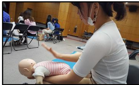
(◀ BLS provider 교육을 받고 있는 학생모습)