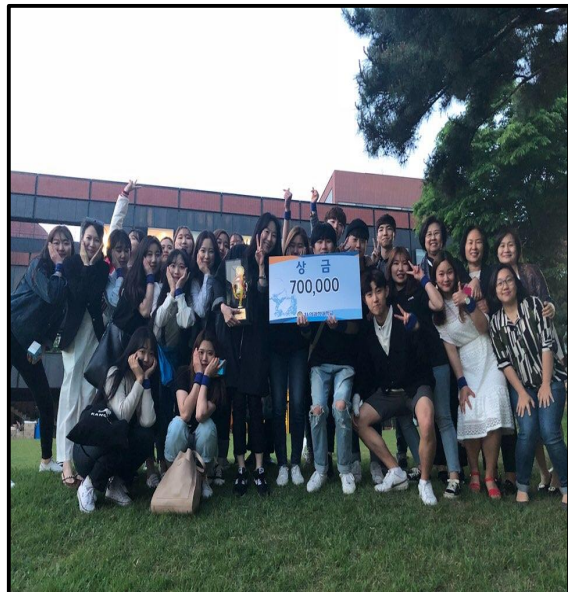
(▲ 이어달리기를 하고 있는 학생의 모습과 종합2위를 차지한 간호학과의 모습)