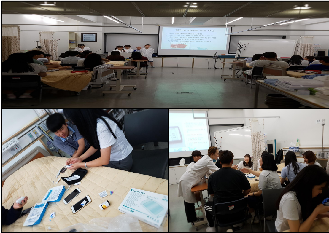
(▲ 간호학과 실습 교육과정 중인 고등학생들)

‘경기 꿈의대학’은 경기도교육청 소재 고등학생들에게 대학교의 전문적인 강의를 경험하도록 해 학생들의 진로에 대한 실질적인 도움을 제공하는 것을 목적으로 하는 프로그램으로 우리 학교 입학처와 경기도교육청의 주관으로 매학기 진행되고 있다.