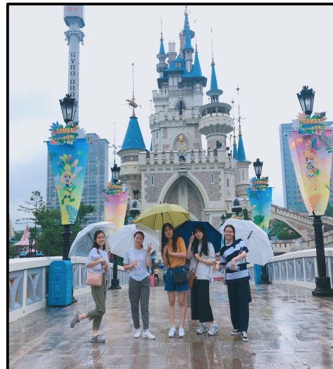
(▲ 신경외과 실습 컨퍼런스 및 롯데월드 문화체험 모습)