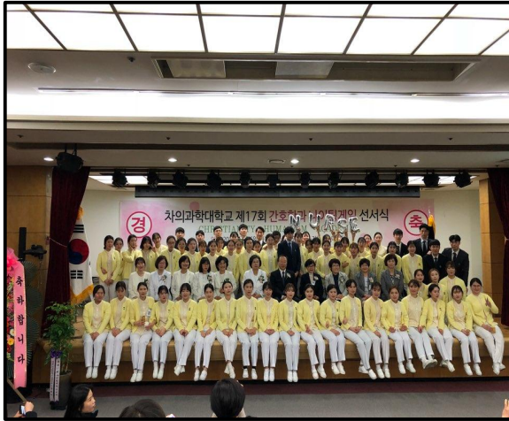
(▲ 나이팅게일 선서식 이후 단체사진)