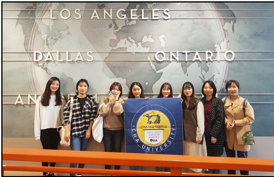
(▲ WCU대학에서의 단체사진)