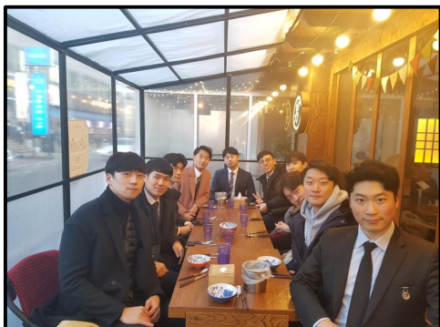
▲ 능률한 CHA-MEN 모임

차 의과학대학교 간호학과에 재학 중인 학생과 졸업한 남학생 선배들과의 친목을 도모하고, 4학년 남자 간호학생 졸업을 축하하는 자리를 마련하기 위해 모임을 가졌다. CHA-MEN 모임은 매년 학교의 지원하에 지속되어 오고 있다. 올해는 재학생과 졸업생 13명이 모였다. 취업을 한 졸업생 선배들의 유익한 정보를 교류하고, 취업에 대한 걱정에 대한 선배들의 조언과 앞으로 준비해야 할 것들과 마음가짐을 배우는 유익한 시