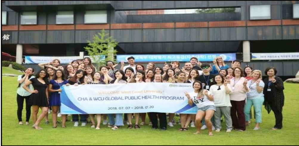
(▲ 포천캠퍼스에서의 GPH 프로그램 단체 사진)

GPH 프로그램은 의료의 국제화에 발맞추어 다양한 인종 및 문화에 경쟁력이 있는 글로벌 리더를 양성하기 위한 국제보건 이론 및 실습프로그램이다. 이 프로그램은 또 우리나라와 미국의 보건의료전달 체계의 특성, 정책 및 현황을 학습하고 외국인 학생들과 이를 비교·토의하며 지역사회 보건에 관한 국제적인 안목을 기르기 위해 마련됐다.