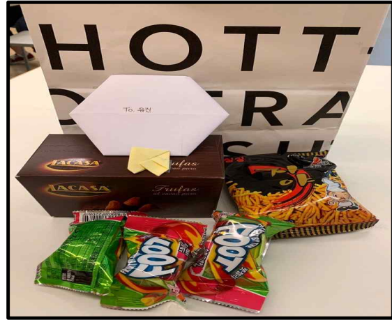
(▲ 마니또 행사 사진)

2019년 5월 6일부터 5월 23일까지 약 3주간 포천캠퍼스에서 19학번 동기들 약 75명이 참여한 가운데 마니또 행사를 진행되었다. 신입생들의 즐거운 학교생활과 19학번 동기간의 친목을 도모하기 위해 마련된 마니또 행사는 1주차 간식과 함께 응원메시지 보내기, 2주차 체육대회로 인한 행사 연기, 3주차 마니또를 알리며 인사를 주고받고 사진 찍기 순으로 진행되었다. 간호학과 1학년 황OO 학생은 “평소 인사만 하던 사이였던 동기들과 더욱 가까워질 수 있었고, 공부에 지쳐 약간은 힘들었던 일상생활에 활력을 불어넣어준 행복한 시간이었다.”라며 소감을 전했다. 이렇듯 마니또 행사는 간호학과 19학번 동기들 각자가 하나로 뭉칠 수 있었던 소중한 시간이었다.