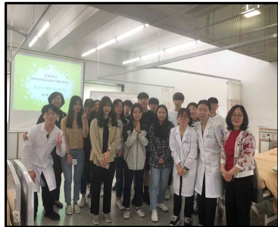
(▲ 구리시 연합 진로적성 토요일 학교를 진행하는 사진)

2019년 6월 1일 고등학교 학생들의 대학탐방 체험학습의 하나인 구리시 토요일 학교 체험학습 팀들이 차 의과학대학교 간호학과를 방문하였다. 구리시 연합 진로적성 토요일 학교 프로그램은 미래 역량 인재 육성을 위해 학생들의 다양한 창의적 체험활동과 자아개발·진로탐색의 기회를 제공하는 구리혁신지구 사업의 일환으로 진행되는 프로그램이다.