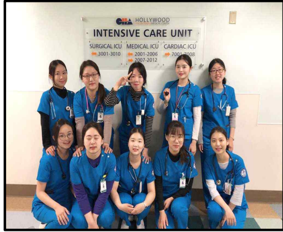
(▲ CHA-HPMC-WCU 활동 사진)

2019년 1월 21일부터 3월 29일까지 10주 동안 West Coast University(WCU)와 ‘CHA-HPMC-WCU Program’ 학점 교류 프로그램을 진행하였다.