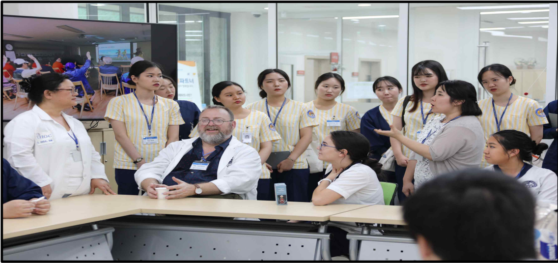
(▲ GPH 활동 사진)

2019년 7월 1일부터 7월 19일까지 우리 대학 간호학과 3학년 학생 20명과 West Coast University(WCU) 간호학과 학생 15명이 참여해, 2주간 포천캠퍼스와 포천시 보건소, 의정부시 사랑 어린이 복지센터, 성남시 정신건강 복지센터, 차움 등 방문하면서 2019학년도 CHA Global Public Health Program(GPH)을 진행했다.