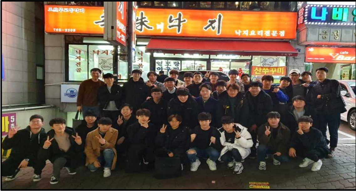
(▲CHA-MEN 모임 사진)

2019년 3월 8일 차 의과학대학교 간호학과에 재학 중인 남학생과 졸업한 남학생 선배들과의 친목을 도모하고, 4학년 남자 간호학생 졸업을 축하하는 자리를 마련하였다.