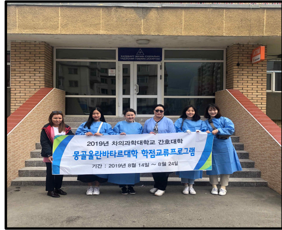
(▲ 몽골 울란바타르 대학 학점교류 프로그램 진행 중인 사진)

2019년 8월 14일부터 8월 24일까지 우리 대학 간호대학 3학년 학생 3명이 몽골 울란바타르대학교 간호대학에서 국제간호 교과목 이수 및 문화체험을 진행하는 학점교류 프로그램에 참여했다.