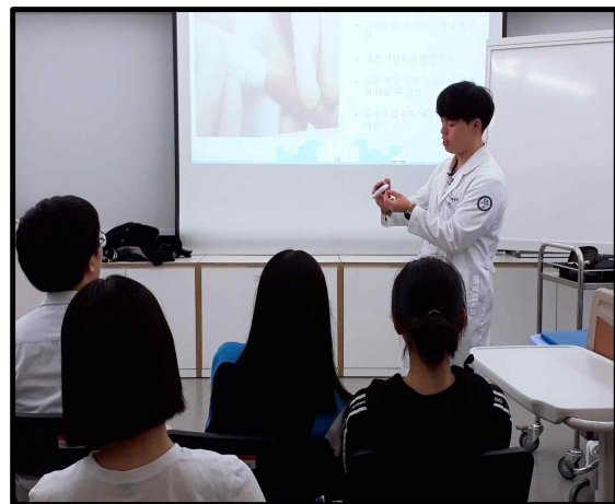
(▲ 경기 꿈의 대학을 진행 중인 사진)

‘경기 꿈의 대학’은 경기도 교육청 소재 고등학생들에게 대학교의 전문적인 강의를 경험하도록 해 학생들의 진로에 대한 실질적인 도움을 제공하는 것을 목적으로 하는 프로그램으로 우리 학교 입학처와 경기도 교육청의 주관으로 매학기 진행되고 있다.