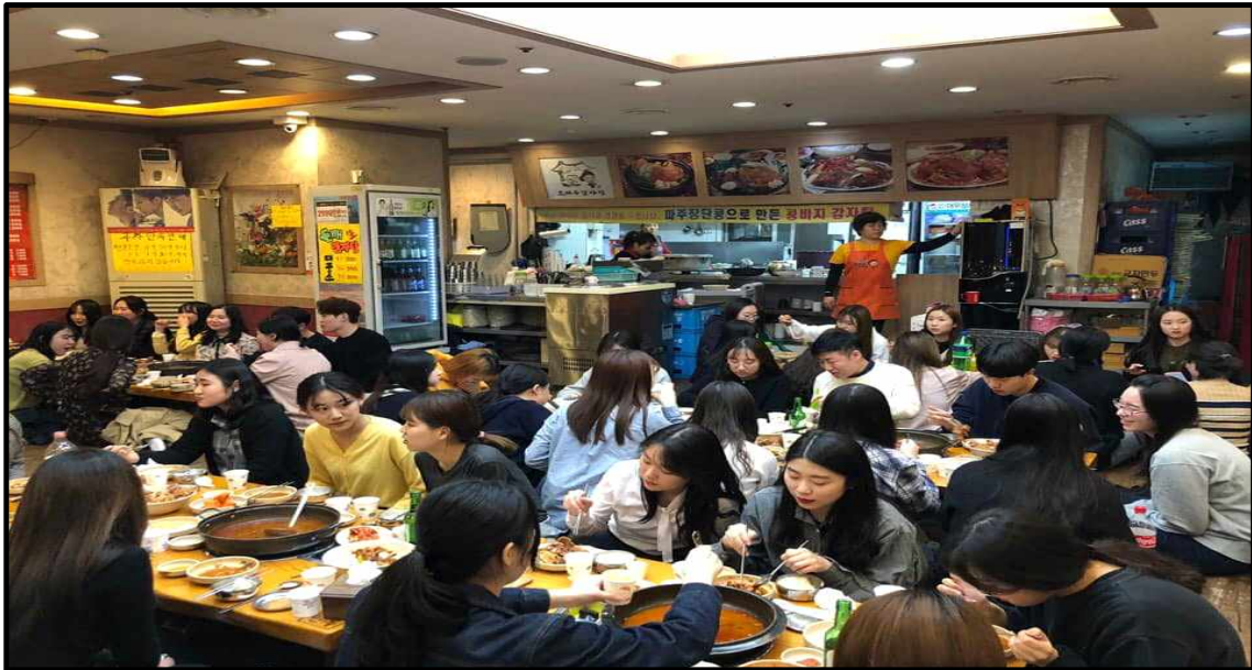
(▲ 18-19학번 총 대면식 사진)

2019년 3월 26일 19학번 신입생들과 18학번 재학생들이 다 같이 모여 식사를 하며 서로 친목을 다지는 총대면식을 송우리 조마루 감자탕에서 개최하였다. 18학번과 19학번은 같이 앉아 저녁을 먹으며 대화를 나누는 시간을 가지고, 뺨 선후배끼리 앞으로 나와 자기소개를 하는 시간도 가졌다. 총대면식이 끝난 이후에는 18학번과 19학번끼리 서로 인사를 나누며 다음 만남을 기약했다. 총대면식을 통해 선후배간 관계가 더 가까워졌으며, 친목을 쌓을 수 있었던 시간이었다.