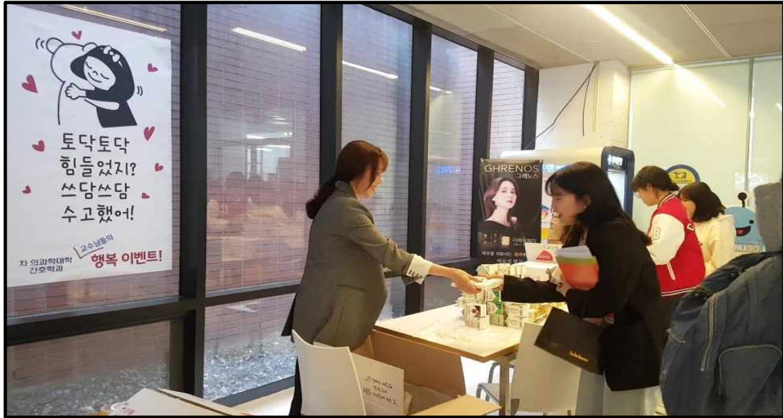
(▲ 교수님께서 토스트를 나눠주는 모습)

2019년 4월 25일 목요일 보는 사람들의 마음까지 따뜻하게 해주는 이벤트가 과학관 지하 1층 입구에서 열렸다. 이 행사는 중간고사 기간 동안 힘들었을 학생들을 위해 교수님들께서 직접 토스트와 음료수를 전해주는 것이다. 대상은 포천에서 수업하는 간호학과 1,2,3 학년으로 하였고 시작은 학생들이 오전 수업으로 인해 배고플 시간대인 11:30~12:20 에 진행하였다.